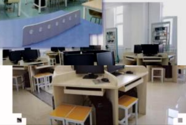
一体化课程教学设计综合实训室