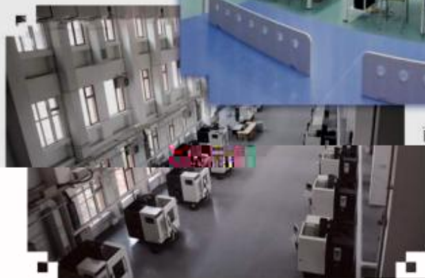
DMG 数控技术训练场所