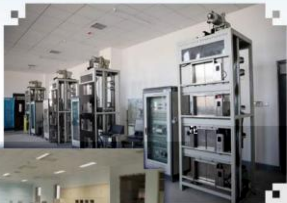
智能电梯安装调试维护训练场所